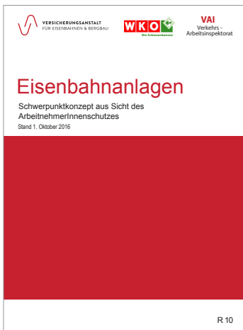
Schwerpunktconcept über die wichtigsten Arbeitnehmerschutzbestimmungen bei Eisenbahnanlagen >> R 10